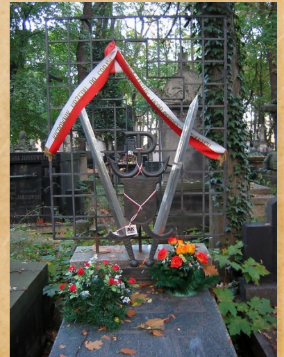
Grób Władysława Liniarskiego na Cmentarzu Powązkowym w Warszawie