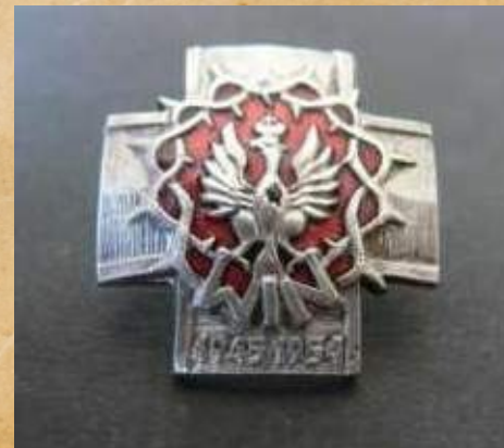
Krzyż Zrzeszenia „Wolność i Niezawisłość” 1945–1954