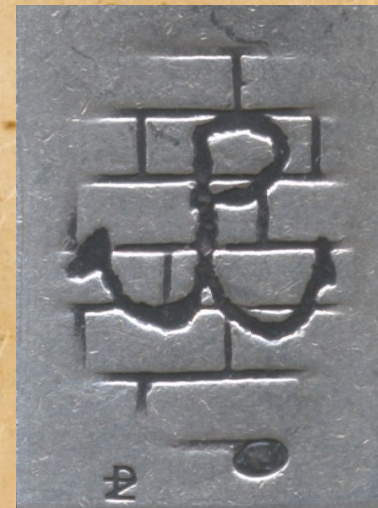
Rewers z wygrawerowaną kotwicą znakiem Polski Walczącej