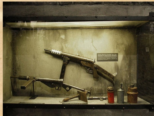
Broń użyta podczas powstania warszawskiego

Działalność AK dostosowana była do dwóch wyraźnie określonych etapów walki z okupantem: walki bieżącej i powstania powszechnego. W zakresie walki bieżącej Komenda Główna AK prowadziła: wywiad, dywersję, akcje odwetowe i ochronne, likwidacje agentów itp. Kwestia powstania powszechnego była uzależniona od sytuacji międzynarodowej. Pod koniec 1943 r. wobec zmian na froncie wschodnim plan powszechnego powstania został zastąpiony planem „Burza”, realizowanym od początku 1944 r. – jego ostatnim aktem było powstanie warszawskie, które po dwumiesięcznych walkach 2 października 1944 r. skapitulowało. Dowódca powstania oraz Komendant Główny AK podzielili losy wielu swoich podkomendnych oraz ludności cywilnej, udając się do niewoli. Latem 1944 r. AK, wobec nacisku ze strony Sowietów oraz podległych im „polskich” władz, znalazła się w trudnym położeniu.