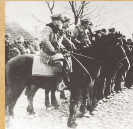
Szwadron kawalerii III Brygady Wileńskiej AK podczas przeglądu na rynku w Turgielach, wiosna 1944 r.