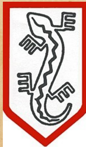
Symbol Związku Jaszczurczego

Narodowe Siły Zbrojne (NSZ) – polska konspiracyjna organizacja wojskowa obozu narodowego działająca w latach 1942–1947, licząca w szczytowym okresie rozwoju około 75 tysięcy ludzi. W czasie okupacji niemieckiej walczyła z Niemcami i zwalczała polskie formacje komunistyczne: Gwardię Ludową, Armię Ludową oraz partyzantkę radziecką i bandy rabunkowe. W okresie późniejszym brała udział w tzw. powstaniu antykomunistycznym walcząc przeciw Armii Czerwonej, NKWD, formacjom Ministerstwa Bezpieczeństwa Publicznego (Korpus Bezpieczeństwa Wewnętrznego i in.) i ludowego Wojska Polskiego. NSZ są często oskarżane o współpracę z Niemcami w końcowej fazie wojny, co wynika z działań niektórych ugrupowań, sprzecznych jednak z rozkazem komendanta głównego NSZ i za taką działalność Komenda Główna NSZ wydała wyrok śmierci. Oskarżana również o antysemityzm. Niektóre jednostki NSZ nie podporządkowały się także legalnym władzom RP na uchodźstwie w Londynie i prowadziły bratobójcze walki z innymi polskimi formacjami partyzanckimi.