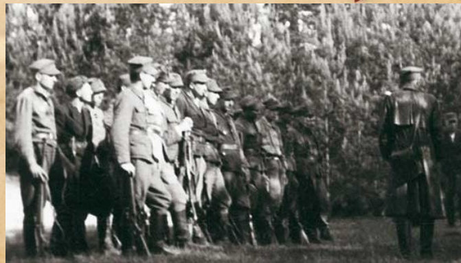
Kurs podoficerski Obwodu Zamość AK, czerwiec 1944 r.

Organem dowodzenia AK była Komenda Główna oraz sztab. Funkcję Komendanta Głównego pełnili kolejno: gen. Stefan Rowecki „Rakoń”, „Grabica”, „Grot” (14 lutego 1942 r. – 30 czerwca 1943 r.); gen. Tadeusz Komorowski „Korczak”, „Znicz”, „Bór” (17 lipiec 1943 r. – 2 październik 1944 r.) oraz gen. Leopold Okulicki „Kobra”, „Niedźwiadek”, „Termit”, który w okresie od 2 października do 26 grudnia 1944 r. pełnił obowiązki Komendanta, a od 26 grudnia 1944 r. do 19 stycznia 1945 r. sprawował jego funkcję.