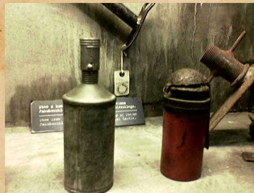
Sidolówka (po lewej) i Filipinka – granaty wyprodukowane przez AK

Na zajętych przez Armię Czerwoną terenach oddziały AK były rozbrajane i likwidowane, a żołnierze podziemia podlegali represjom ze strony NKWD i polskiego aparatu bezpieczeństwa. Trudna sytuacja zewnętrzna oraz brak perspektywy ułożenia jakiegoś modus vivendi z Armią Czerwoną spowodowały, że ówczesny dowódca AK gen. Leopold Okulicki „Niedźwiadek” 19 stycznia 1945 r. podjął decyzję o jej rozwiązaniu, co stanowiło pierwszy etap samolikwidacji Polskiego Państwa Podziemnego