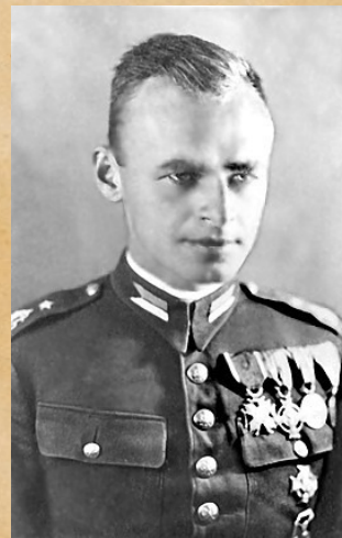
Witold Pilecki - rotmistrz kawalerii Wojska Polskiego, Autor raportów o Holocauście, tzw. Raportów Pileckiego. Oskarżony i skazany przez władze komunistyczne Polski Ludowej na karę śmierci, stracony w 1948.