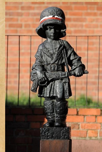
Pomnik Małego Powstańca z 1983 roku przy ul. Podwałe w Warszawie