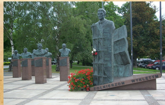
Pomnik Żołnierzy Wyklętych w Rzeszowie