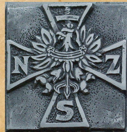
Krzyż NSZ na tablicy pamiątkowej w Sanoku