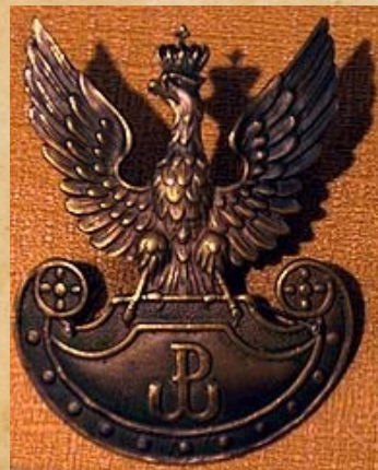
Mosiężny orzełek Armii Krajowej, bity w latach 1942–1945, ze zbiorów Muzeum Hymnu Narodowego w Będominie