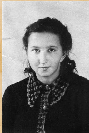
Danuta Siedzikówna "Inka"