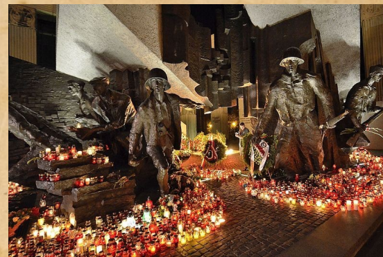
Fragment Pomnika Powstania Warszawskiego z 1989 roku na pl. Krasieńskich w Warszawie