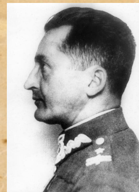
Gen. brig. August Emil Fieldorf, budował struktury organizacji NIE, powołanej do stawienia oporu okupacji radzieckiej, ofiara mordu sądowego w 1953 roku