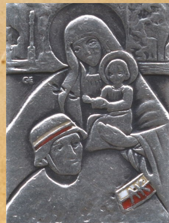
Awers srebrnego medalika z Matką Boską